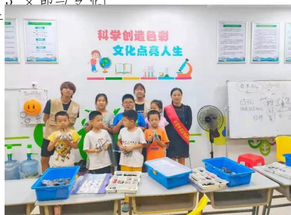
“科学助力老区乡村振兴”志愿