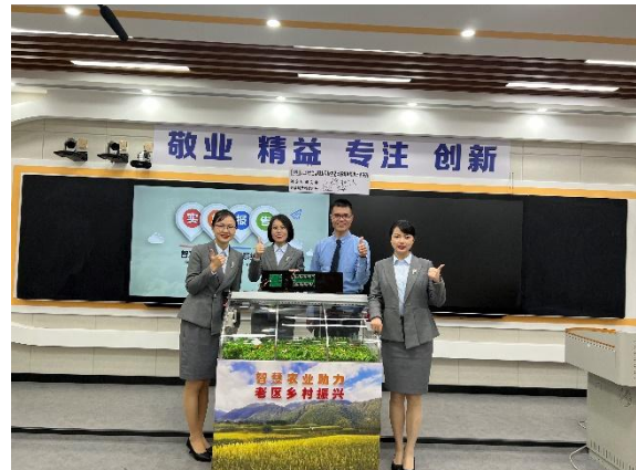
图6《智慧农业大棚监控系统设计》获2021年全国职业院校技能大赛教学能力比赛高职组专业技能课程一组二等奖