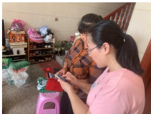
图2 指导农户使用智能手机