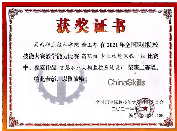
图7《智慧农业大棚监控系统设计》获2021年全国职业院校技能大赛教学能力比赛高职组专业技能课程一组二等奖