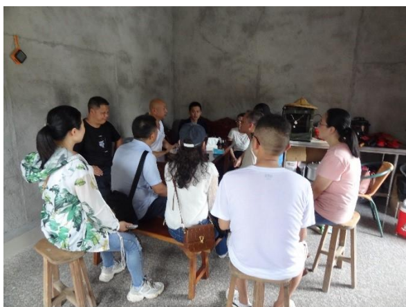
图1 实地调研走访农户