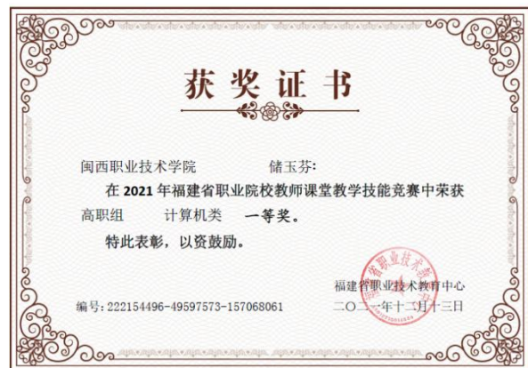
图8《嵌入式微控制器技术与应用》——智慧农业大棚气象监控器设计荣获2021年福建省职业院校教师课堂教学技能竞赛中高职组计算机类一等奖