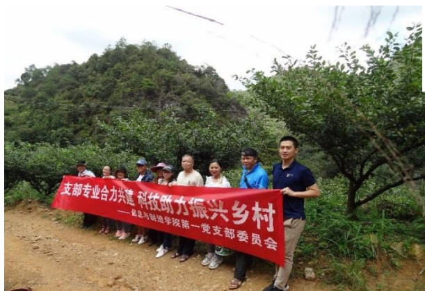
图3 支部与专业团队联合开展“科学助力老区乡村振兴”志愿服务活动